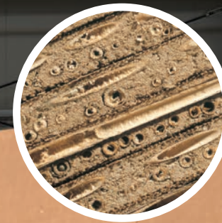
Querschnitt durch Lehmbauplatten

Lehm-Trockenputzplatte 16 mm, angesetzt mit Lehmklebe- und Armierungsmörtel